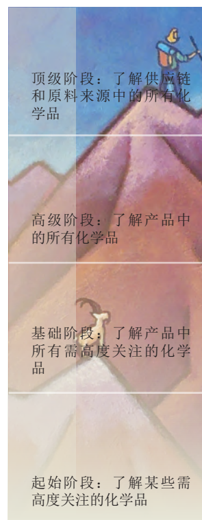
图2：了解产品和供应链中化学品的阶段

对化学品信息的需求之所以日益增加，是因为“零售商要争取那些需要可持续产品的顾客，支持他们对于可持续性的诉求，欧洲通过的多项标准也影响了当今全球经济下的大型零售商”（Rizzuto，2014年）。这些零售商占据了庞大的市场份额，它