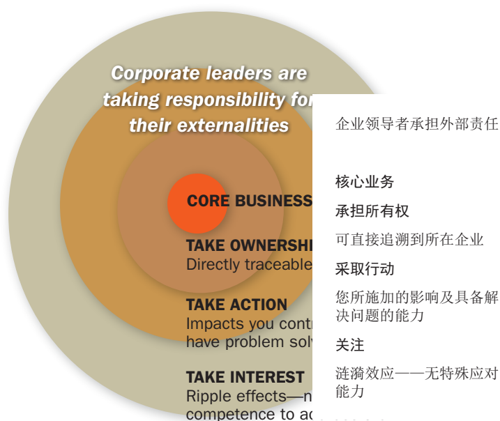
图1：透明化时代的领导力：责任涟漪（来源：Rossi、Peele和Thorpe在2012年发布的图表；编制依据Meyer和Kirby，2010年）

（Meyer和Kirby，2010年）。他们指出，透明度不断扩大是从核心业务扩散开来的“责任涟漪”（见图1）。尽管Meyer和Kirby并未明确提及产品中的化学品，但含义非常清楚：企业（尤其是品牌商）在供应链上下游正面临着不断增长的透明化需求。将Meyer和Kirby的“责任涟漪”运用到实现化学品透明化的趋势中，我们可以看到是由下游企业对其产品中的化学品承担所有权，对其供应链中的化学品采取行动并采取部门措施来加强化学品管理，以及关注其原料的来源和化学品监管措施。